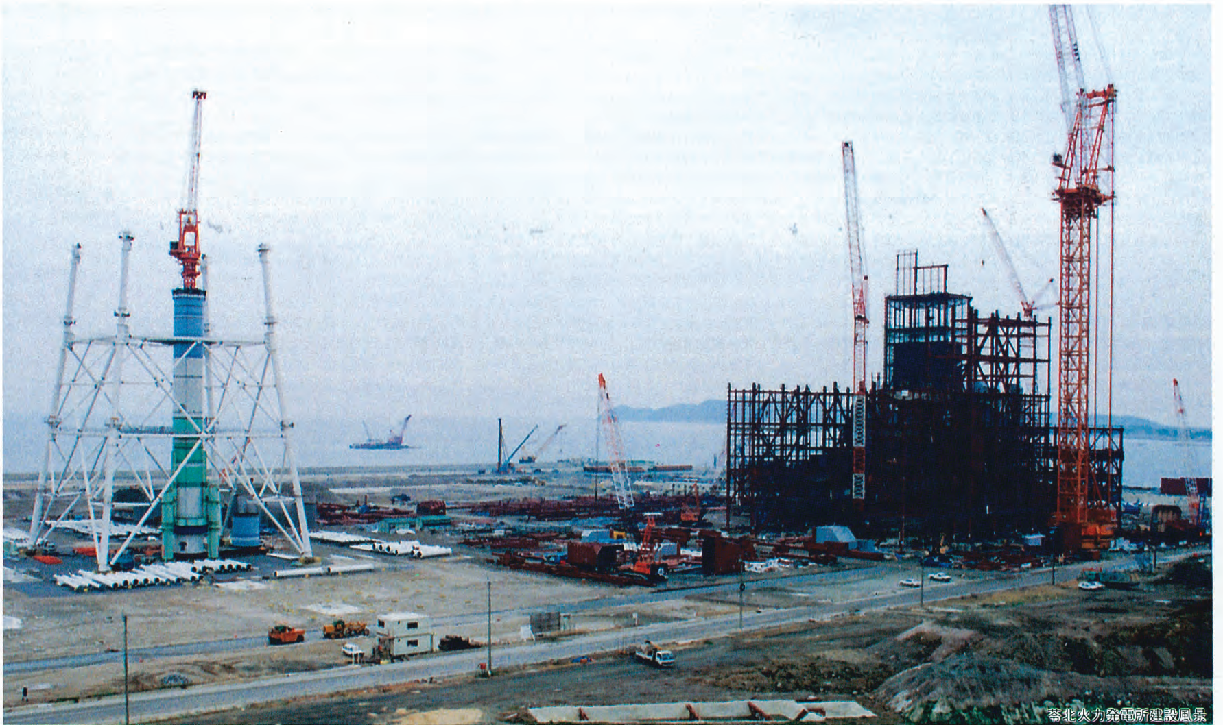
琴北火力発電所建設風景