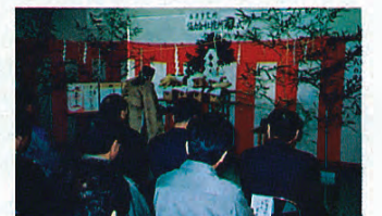
△厳かに行われる竣工式神事