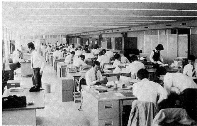
△ 広がった事務所内。手前側が事務系、奥が技術系の各課