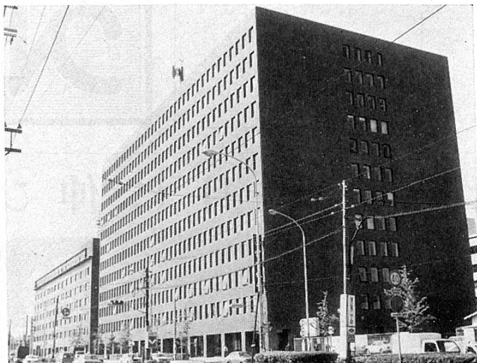
△ 電気ビル本館（奥のビルは別館） この4階が当社事務所である。