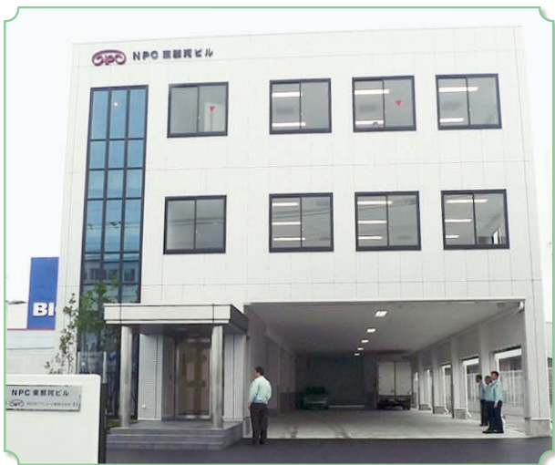
▲完成したNPC東那珂ビル